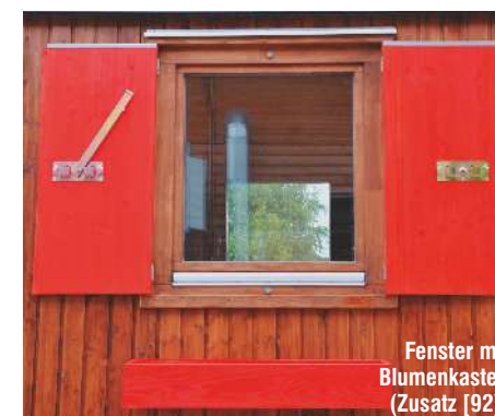
Fenster mit Blumenkasten (Zusatz [92])

Weitere Zusatzelemente fertigen wir auf Wunsch nach Ihren Vorstellungen!