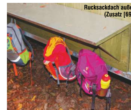
Rucksackdach außen (Zusatz [69])