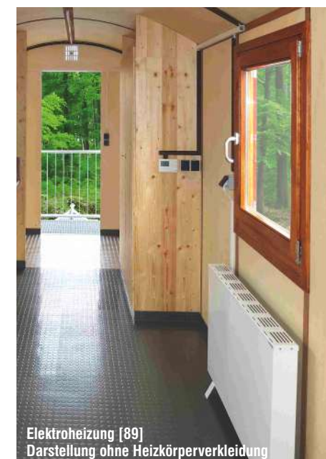
Elektroheizung [89] Darstellung ohne Heizkörperverkleidung

Weitere Zusatzelemente fertigen wir auf Wunsch nach Ihren Vorstellungen!