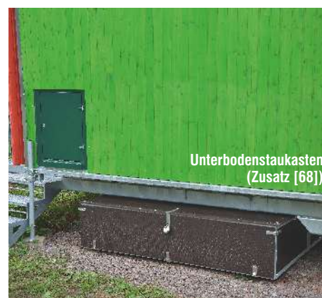
Unterbodenstaukasten (Zusatz [68])