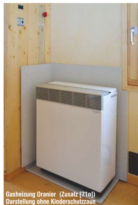
Gasheizung Oranier (Zusatz [71o]) Darstellung ohne Kinderschutzzaun