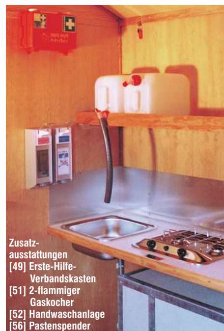
Zusatz- ausstattungen [49] Erste-Hilfe- Verbandskasten [51] 2-flammiger Gaskocher [52] Handwaschanlage [56] Pastenspender