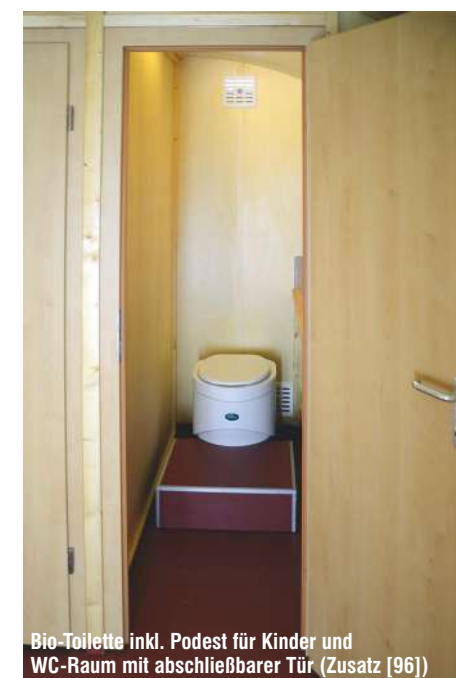
Bio-Toilette inkl. Podest für Kinder und WC-Raum mit abschließbarer Tür (Zusatz [96])