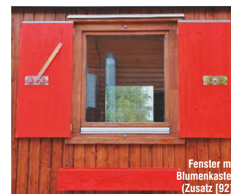
Fenster mit Blumenkasten (Zusatz [92])

Weitere Zusatzelemente fertigen wir auf Wunsch nach Ihren Vorstellungen!