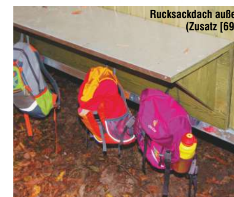
Rucksackdach außen (Zusatz [69])